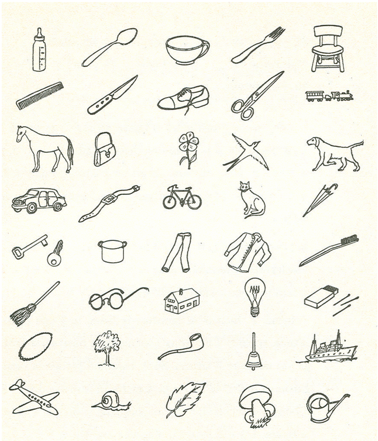
Fig. 1– Vocabolario figurato

Le singole immagini vanno incollate su cartoncino (cm. 10 x 14) e numerate sul retro. La numerazione delle immagini va da 1 a 40 e procede da sinistra a destra.